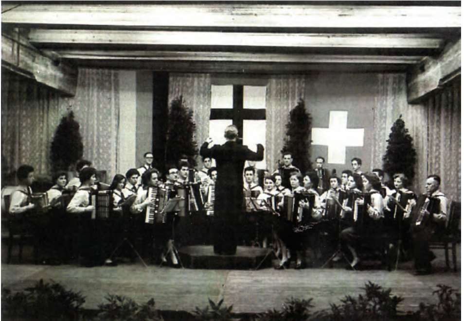
Damals und Heute